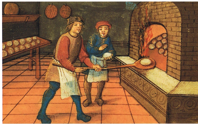
El panadero. Worldhistory .

carnicero, casero, casquero, castillero, cazador, cebollero, cerero, cerrajero, cestero, cillero, cintero, clavero, colchero, comendador, cómitre, cónsul, contador, corredor, corregidor, criado, cruzado, cuadrillero, cubero, custodio, cura, dorador, doctor, emperador, escobero, escribano, escudero, herrero, herrero, ferrón, forero, frade, fraile, freire, freile, fustero, granadero, herrador, herrero, hidalgo, hornero, hortelano, infante, juez, jurado, justicia, labrador, lanero, lavandera, lencero, leñero, librero, linero, llavero, lombardero, maestro, mancebo, mantero, marinero, matador, mayoral, mayordomo, mediero, melero, merino, mesonero, mimbrero, molinero, monedero, montero, mulero, notario, ollero, ovejero, pagador, palomero, panadero, pañero, pastor, peinador, pellejero, peón, pescador, piñero, pintor, pocero, portero, príncipe, quintero, quiñonero, racionero, rastrero, redero, rentero, rey, rosero, sacristán, salinero, sangrador, santero, sardinero, sastre, segador, señor, sesmero, sillero, soldado, tabernero, tejedor, tejero, tendero, tenedor, torero, tundidor, valido, vicario, yuguero.