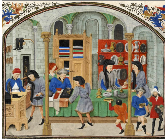
El comercio.

compañía en un país extranjero. La institución del consulado del mar se desarrolló enormemente en los dominios de la corona de Aragón a semejanza de los existentes en el entorno mediterráneo, y a su vez sirvió de modelo para la creación de consulados en la corona de Castilla: el de Burgos (1494) y el muy poderoso consulado de mercaderes de Sevilla (1543), para el que Juan de Herrera diseñó una magnífica Lonja junto a la fachada sur de la catedral.