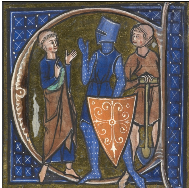
Orator, bellator, laborator. Wikimedia .

El top ten —dijéramos— de los apellidos de profesión (Guerrero, Caballero, Herrero, Montero, Hidalgo, Ferrer, Pastor, Merino, Rey, Escudero) nos devuelve la imagen neta de un mundo feudal . Está el rey, máxima expresión del señor feudal. Tras el genérico 'guerrero', aparecen el caballero, el hidalgo y el escudero. Los acompaña el montero, que se dedicaba al servicio del rey en las cacerías. Y, entre los oficios artesanales, está el de herrero (Herrero y el primer apellido de oficio en catalán, Ferrer), estrechamente unido a la forja de las armas. Completan la estampa el pastor y el merino, al cuidado de los rebaños del señor. Estos formarían el estrato más antiguo de un retrato en movimiento.