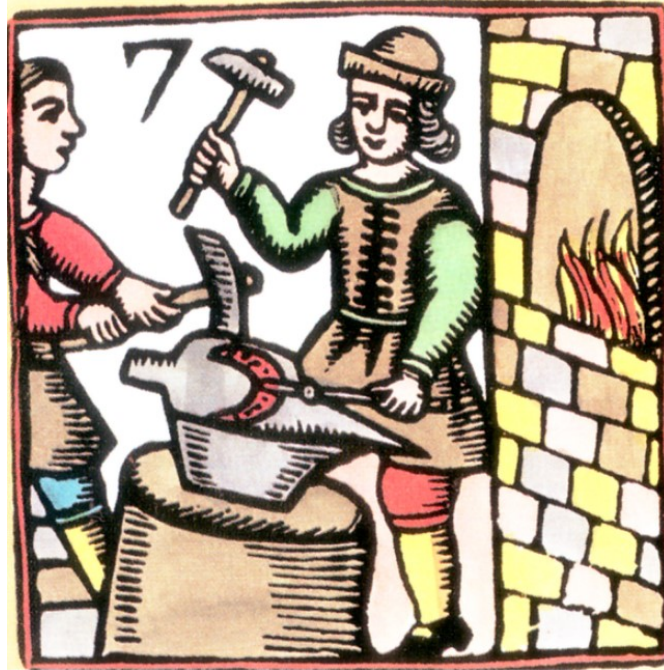
El herrero.