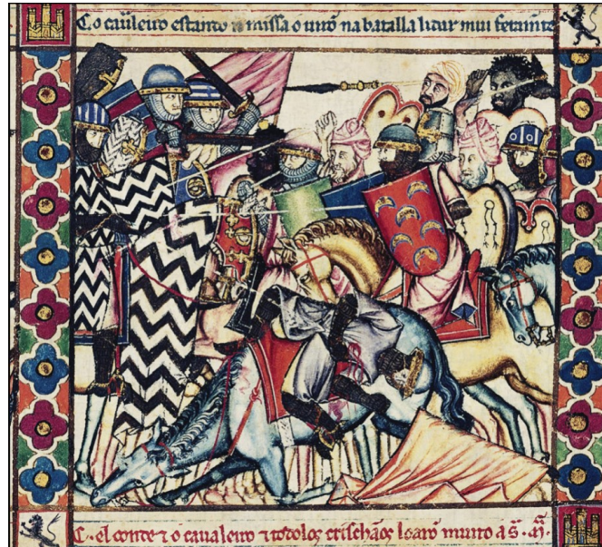
La Reconquista, la guerra. Miniatura en las Cantigas de Santa María de Alfonso X el Sabio, Códice Rico. Real Biblioteca Digital del Monasterio de El Escorial . Patrimonio Nacional.

En documentos de los siglos IX, X y XI aparecen nombres como tejedor, herrero, abarquero, peletero, carpintero u ollero, muestra de una incipiente industria (Martínez Meléndez 1991: 10). En el otro extremo, las primeras dataciones más tardías de los oficios-apellido del inventario que nos ocupa son de principios del XVII: cuadrillero (1605), marchante y merchante (1612).