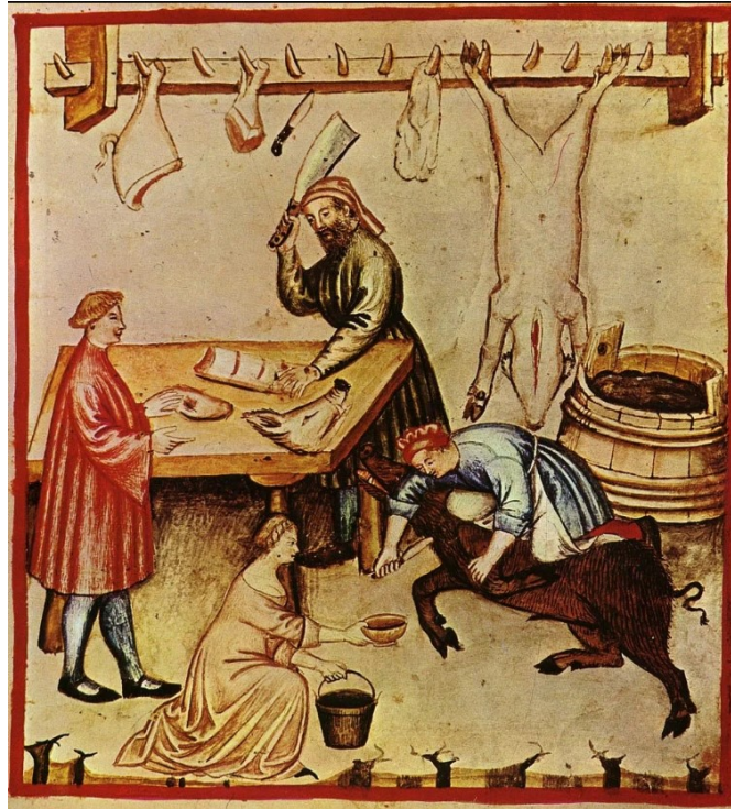
El carnicero.

Carnicero se ha formado sobre «carniza», del latín vulgar carnicea , derivado de caro , carnis , 'carne'. «Peón» se podía referir al soldado de infantería, sentido este último que tenía en latín vulgar pedo , -onis .