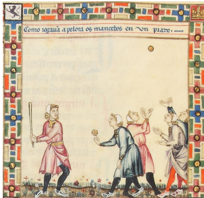
«Cómo jugaban a pelota os mancebos en un prado». Miniatura en las Cantigas de Santa María de Alfonso X el Sabio, Códice Rico, CSM74 fol-061V. Real Biblioteca Digital del Monasterio de El Escorial . Patrimonio Nacional.

Fuera de estos cuatro ámbitos quedan un puñado de profesiones variopintas, que encuadraríamos hoy posiblemente en el sector servicios. Los ayudantes Criado, Mozo, Page, Mancebo, Mayordomo, Portero; los médicos Doctor (Dotor) y Cirujano; los músicos Gaitero, Cantador y Organista; Barbero, Barquero, Pinero o Bachiller.