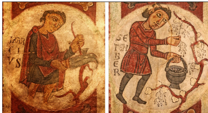
El labrador (Calendario agrario de la Colegiata de San Isidoro de León ).

7. La lista de los diez apellidos más frecuentes de origen catalán ofrece en conjunto un perfil más artesanal , por su orden: Ferrer, Ballester, Fuster, Ferré, Marí, Mestre, Sabater, Pellicer, Pagès, Sabaté. Hacen aparición ahora el carpintero, el marinero, el maestro (de cualquier oficio), el zapatero, el peletero y el labrador . Posiblemente, dentro de un contexto también más urbano, pues es en los núcleos urbanos donde florecen los oficios artesanales y donde se distingue al labrador ( pagès ) como un oficio singular.