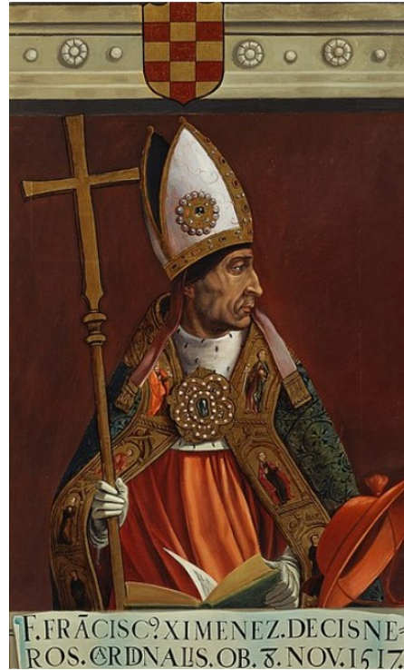
El Cardenal Cisneros.

A partir de entonces y en este contexto se fue extendiendo el uso de un libro de actas de bautismos, en donde aparecían los nombres del bautizado, del padre y de la madre, del oficiante y de los padrinos . Se incluía también entre los recién nacidos a los esclavos, a los niños expósitos y a los ilegítimos. Ya en estos primeros tiempos se anotaba habitualmente el apellido del padre, a veces su profesión, y con frecuencia el apellido de la madre.