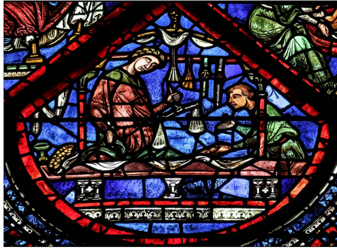
El mercader (de especias).