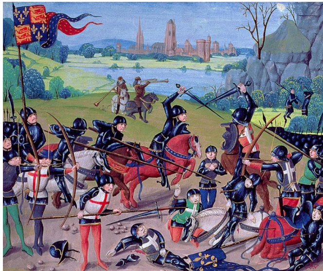
Guerreros en la batalla de Agincourt.

El primer apellido que indica una profesión es Guerrero. Lo llevan 79.985 personas en España y ocupa el lugar 47 en el total de apellidos.