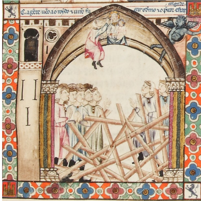
Un pintor de frescos agredido por el demonio y salvado por la Virgen. Miniatura en las Cantigas de Santa María de Alfonso X el Sabio, Códice Rico, CSM74 fol-109R. Real Biblioteca Digital del Monasterio de El Escorial. Patrimonio Nacional. Véase web cooperativa Alfonso X el Sabio 1221-2021, Cantiga 74 el pintor y el demonio .

Ejército, nobles y funcionarios civiles hacen el segundo mayor aporte de profesiones a la antroponimia , con 75 apellidos. Lo forman personas al servicio de la nobleza, como lo serían aquellas apellidadas Barón, Conde, Marqués, Emperador o Rey, junto a titulares como Fidalgo, Hidalgo, Infanzón, Escudero. Encontramos profesionales de la guerra de diferente responsabilidad, desde Soldado, Caballero, Cruzado, Cabido, Infante, Guía, Ballestero, Lombardero, Piquero, Galeote, Cazador, a mandos como Alférez y Capitán o jefes como Adalid, Arráez, Almirante, Adelantado, Mariscal. Entre los diversos puestos al servicio de la administración, llama la atención el gran número de ellos relacionados con la justicia: Juez, Jurado, Justicia, Alguacil, Corchete, Alcaide, Alcalde, Verdugo, Galafate, Contador, Corregidor, Cónsul.